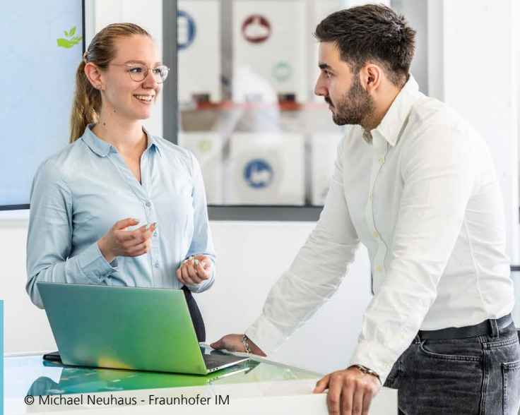
© Michael Neuhaus - Fraunhofer IM